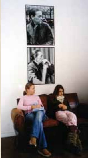
In Helene Weigels Direktorenzimmer: Warten auf den Auftritt

So umfassend wie die eingangs kurz umrissenen Aufgaben des Deutschunterrichts sind zum Glück auch die Möglichkeiten der Umsetzung und Gestaltung. Das zeigt ein Blick auf die zahlreichen Aktivitäten, die in den vergangenen Jahren im Rahmen des Deutschunterrichts durchgeführt und teilweise als feste Bestandteile in den Jahres- und Semesterplänen verankert wurden. Dazu gehören Vorlesewettbewerbe, Bibliotheksbesuche und Zeitungsprojekte, das Einüben fachspezifischer Methoden und Fertigkeiten im Rahmen der Methodenwoche, das Schreiben an anderem Ort, wie zum Beispiel im Museum oder in der U-Bahn, die Teilnahme an den Projekten von „Kulturpate“ e.V., u.a. am alljährlich stattfindenden Fest der Herbstliteratur, literarische Stadterkundungen und Exkursionen in die nähere oder weitere Umgebung auf den Spuren von Theodor Fontane, Franz Kafka oder der Klassiker Goethe und Schiller.