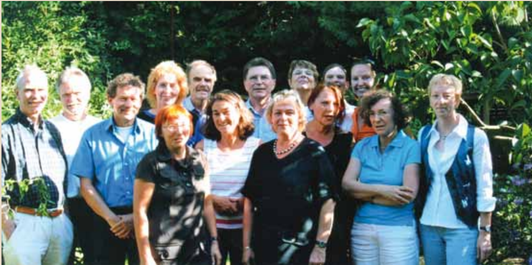
Das Englischteam 2007

„Adieu, adieu, adieu. Remember me.“ Das sagt der Geist von Hamlets Vater, bevor er verschwindet. Und mit diesen Worten habe ich mich bei unserer denkwürdigen Abschiedsfeier am 9.7.07 von meinen Kolleginnen und Kollegen verabschiedet. Nun meldet sich der Geist wieder, zwar nicht aus dem Jenseits, doch aus der Ferne des Pensionärslebens, weil er gerufen wurde. Er soll sich erinnern an die schöne Zeit – damals bei Leonardo. Aber woran erinnere ich mich überhaupt und vor allem gern? Woran werden sich unsere Schüler am ehesten erinnern? Wahrscheinlich nicht an die unzähligen Unterrichtsstunden, Lehrbuchlektionen, Klausuren, Grammatikübungen oder Vokabeltests, sondern an die Extras – und davon gab es bei unserem Englischteam viele. Von diesen Extras will ich erzählen, aus persönlicher Sicht und ohne Anspruch auf Vollständigkeit.