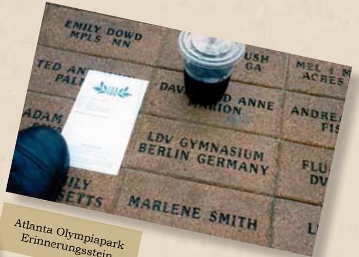
Atlanta Olympiapark Erinnerungsstein