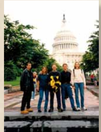
Washington / DC 1998