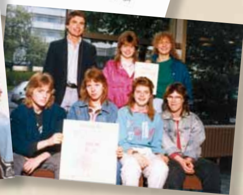
Fremdsprachentag 1989 Klasse 7.4