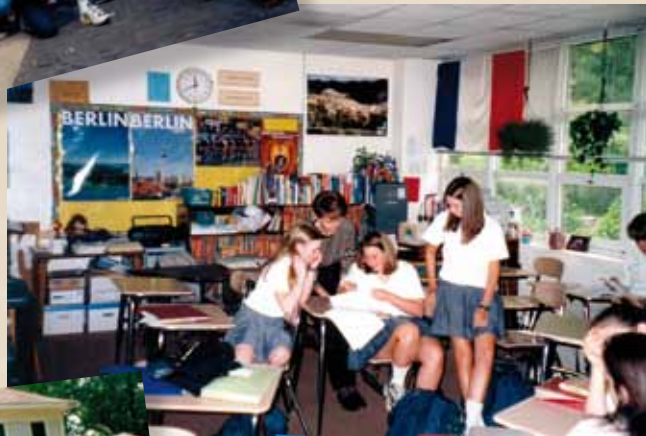
Lovett School Atlanta Fachraum Fremdsprachen