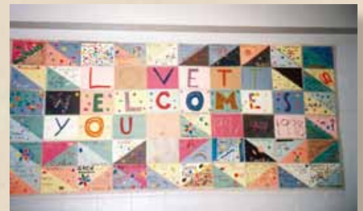
Lovett School Atlanta, Eingangshalle

„Die ethnische Vielfalt Londons bei einer Fahrt in der überfüllten U-Bahn hautnah zu erleben, ist eben nicht dasselbe wie die Lektüre eines Textes über „Multicultural Britain“ im Lehrwerk.“