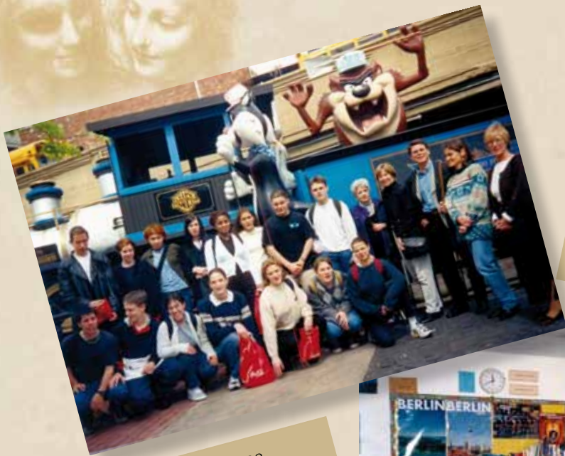
Atlanta 1998 Warner Bros. Studios