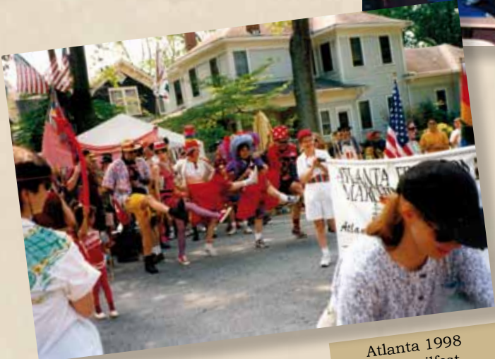
Atlanta 1998 Stadtteilfest